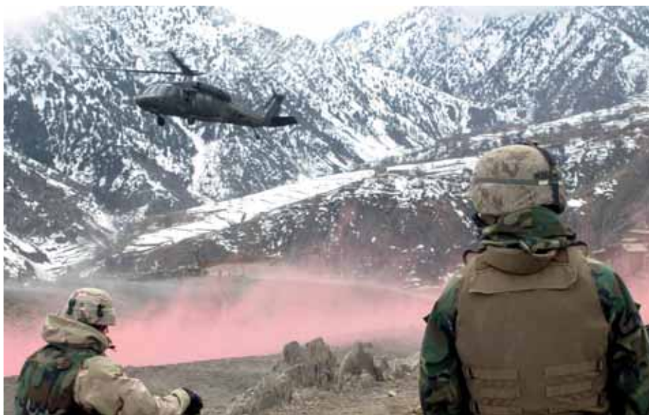
US-Soldaten der »Operation Enduring Freedom« (OEF).

Um den politischen Zweck in die Tat umzusetzen, gilt es also zunächst zu identifizieren und zu vereinbaren, welche gemeinsamen Interessen der 26, dann 28 Mitgliedstaaten vorliegen. Die (vor)schnelle Konzentration auf die unterschiedlichen, abweichenden, ja strittigen Punkte schmälert die Chancen für kohärentes pro-aktives Handeln. In der Situation nach dem 11. September 2001 bestand eine große Solidarität mit den angegriffenen Vereinigten Staaten. War der Terrorismus im Konzept von 1999 noch als eine mögliche Gefahr bezeichnet worden, war, ist und bleibt transnationaler Terrorismus eine »klare und gegenwärtige Bedrohung«. Diese Gefahr entstand außerhalb des eigenen Territoriums und weit über dessen Periphe-