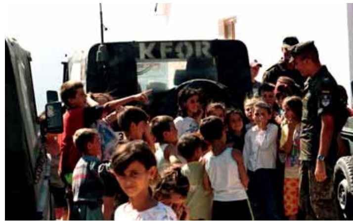
Deutsche Soldaten der KFOR-Truppe beim Einsatz im Kosovo.

Blickt man in diesen Wochen auf die Allianz und ihre Mitglieder sowie Beiträge und Kommentare in der interessierten Öffentlichkeit, kann man eine Reihe sehr unterschiedlicher Beobachtungen machen und Feststellungen treffen. Die Allianz, ist zu hören, biete eigentlich ein ganz vernünftiges