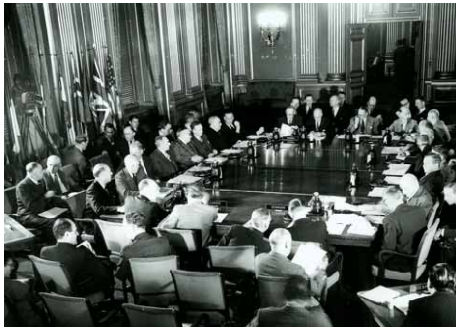
Erste Sitzung des Nordatlantikrats in Brüssel am 4. April 1949.

Die Nordatlantische Allianz ist mit ihrer 60-jährigen Geschichte und vor allem mit ihrem einzigartigen Erfolg in der Ost-West-Auseinandersetzung der zweiten Hälfte des 20. Jahrhunderts ein geschichtliches Unikat unter den vielfältigen Formen, Inhalten, Zwecken und der Vitalität früherer Bündnisse, Koalitionen und Allianzen. Den-