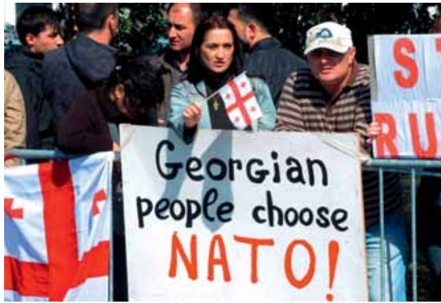
Demonstrationen von Georgiern am NATO-Hauptquartier gegen den Einmarsch von russischen Truppen in ihr Land.

Eine Allianz mit 28 Nationen bedeutet eine große Vielfalt, auch in den »militärischen Kulturen«. Das wirkt sich bis in die Planungs- und Einsatzverfahren aus. Trotz aller über die Jahrzehnte durchgeführten Standardisierungen und der Abstimmung von Doktrinen und Verfahren bleibt es eine dauernde Herausforderung in den heutigen komplexen Einsätzen ein quasi integriertes Führen und Handeln der nationalen Teilstreitkräfte und der notwendigen, ja unverzichtbaren Multinationalität bestmöglich sicherzustellen.