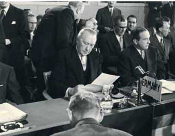
Bundeskanzler Konrad Adenauer unterzeichnet die Beitrittsurkunde in Brüssel am 6. Mai 1955.

In Deutschland wird oft vergessen, dass schon in den frühen 50er Jahren darüber debattiert worden ist, welche und wie viele Streitkräfte gebraucht werden und wie viele sich die Staaten leisten können, ohne die notwendige wirtschaftliche Entwicklung und die soziale Stabilität zu gefährden, die man doch gerade mittels der Verteidigungsvorsorge bewahren wollte.