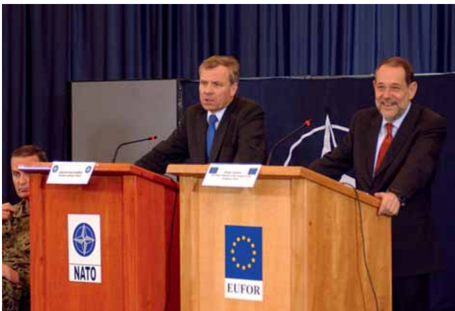
NATO-Generalsekretär Jaap de Hoop Scheffer (li.) und der EU-Beauftragte Javier Solana bei einer gemeinsamen Pressekonferenz.

In einer Welt, in der auch die Sicherheitsthemen zunehmend globalisiert sein werden, ist die Allianz richtig beraten, mit Japan als Bündnispartner der eigenen Führungsmacht ebenso auf funktionale und regionale Zusammenarbeit zu setzen wie mit China als ausgreifender Großmacht