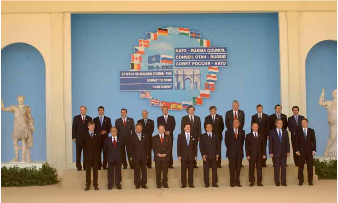
Sitzung des NATO-Russland-Rats im Jahre 2002.