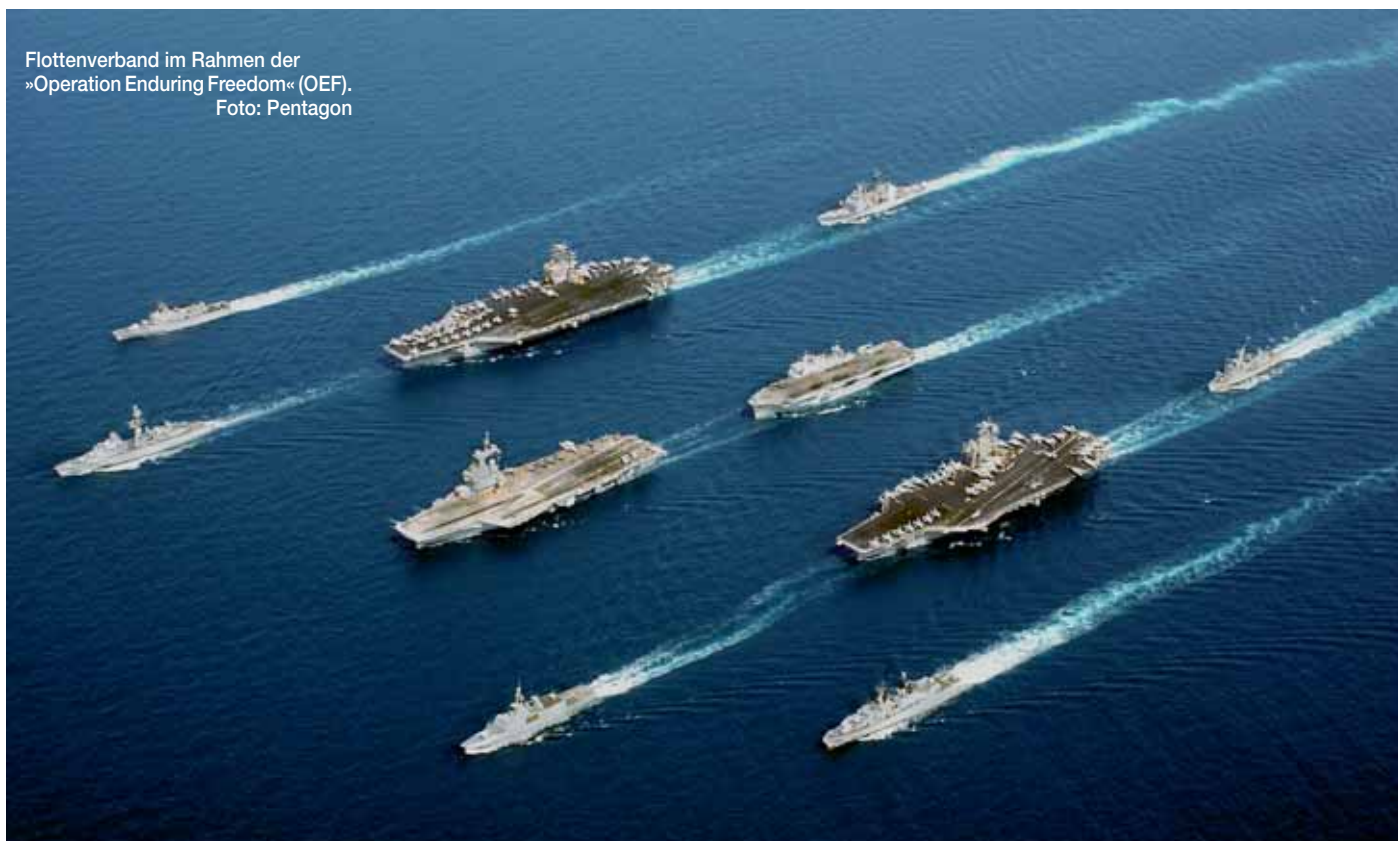
Flottenverband im Rahmen der »Operation Enduring Freedom« (OEF).

Die oben genannten drei Gruppierungen verdeutlichen, dass beide Grundsätze von den Verbündeten nicht zu einem operationalisierten, handhabbaren internen Konsens für konkrete Situationen weitergeführt worden sind. Will die Allianz immer schwieriger werdende ad hoc Diskussionen im je konkreten Fall eingrenzen, wird sie mit der »Erklärung zur atlantischen Sicherheit« beim Gipfel in Straßburg/Kehl/Baden-Baden den Weg für einen Konsens weisen müssen. Eine erweiterte Bestimmung künftiger Abschreckung und dazu erforderliche Schritte werden erforderlich, vor allem aber wird die Konzeption für Aufklärung und Nachrichtendienste, für polizeiliches und militärisches Handeln vor Aktionen, Attentaten oder Angriffen vorangebracht werden müssen.