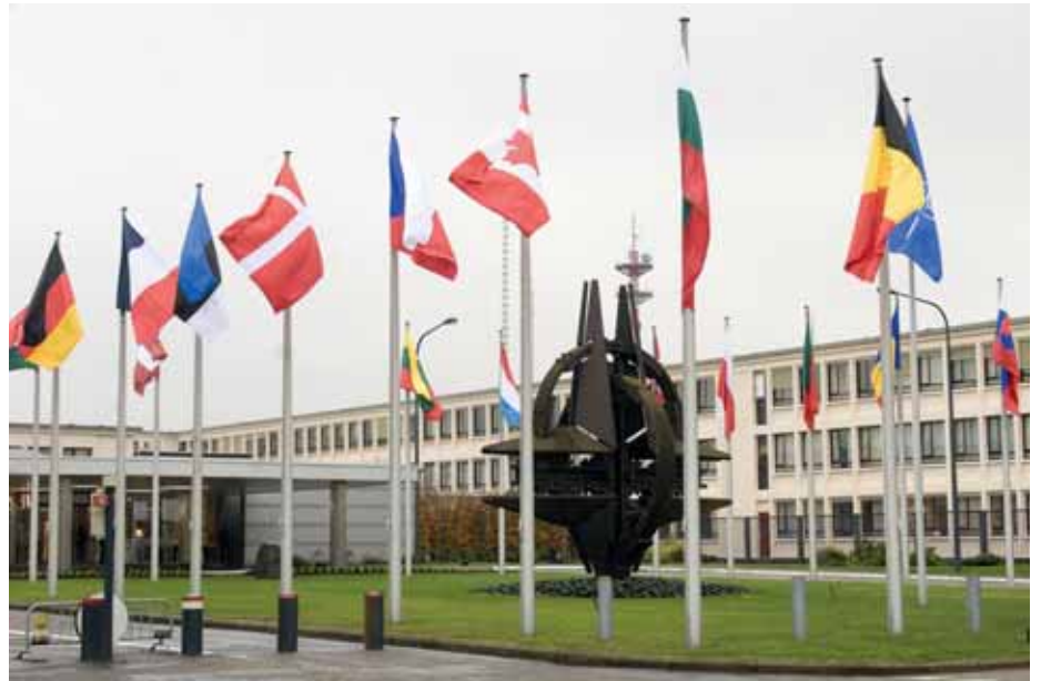
Das NATO-Hauptquartier in Brüssel.

Die Ausschaltung von Konflikten in ihren internationalen Wirtschaftsbeziehungen war ebenso ein Ziel, wie die Ermutigung zu wirtschaftlicher Zusammenarbeit zwischen ihnen. Das bedeutet, dass die heutige Finanz- und Wirtschaftskrise auch von der Allianz aufmerksam zu begleiten ist, auch weil dadurch konkrete sicherheitspolitische Folgen und Risiken entstehen können.