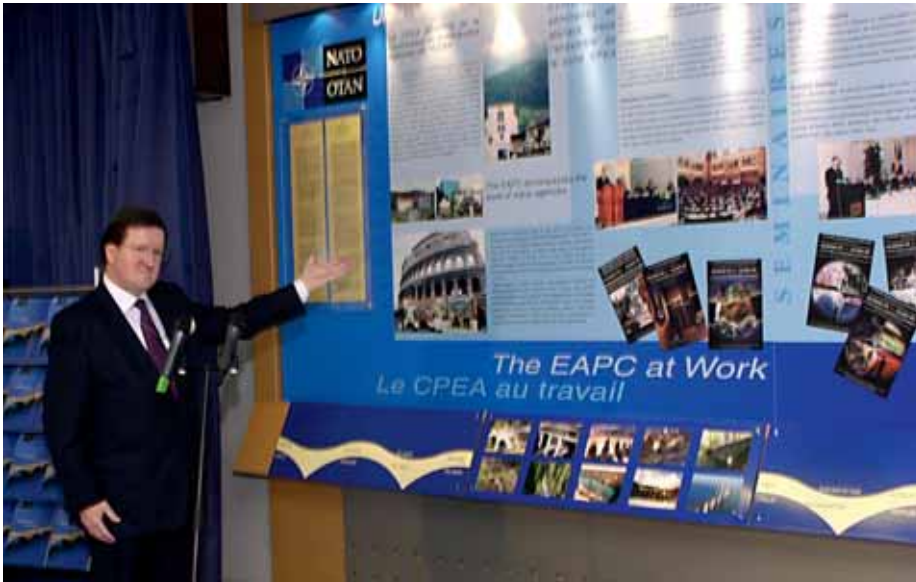
Ausstellungseröffnung zu 10 Jahre EAPC durch NATO-Generalsekretär Lord Robertson.