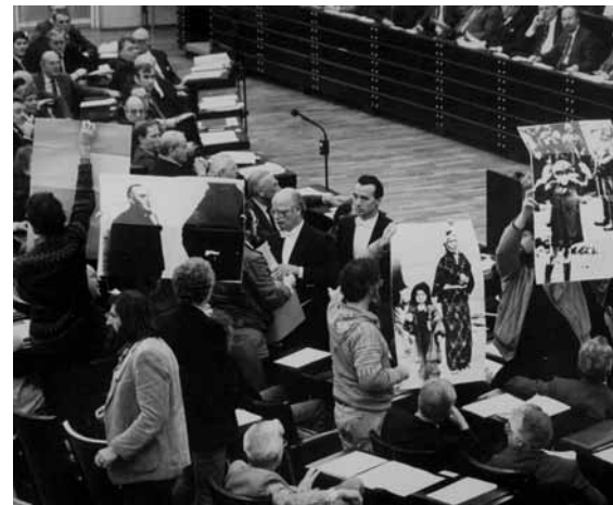
Während der Regierungserklärung von Bundeskanzler Kohl zur Nachrüstungsdebatte im Deutschen Bundestag in Bonn am 21.11.1983 halten Abgeordnete der Grünen Großfotos aus Kriegs- und Krisenzeiten hoch. Der Bundestagspräsident ließ die Fotos durch Saaldienere entfernen. Die Debatte zur NATO-Nachrüstung wurde von Demonstrationen und Protesten im gesamten Bundesgebiet begleitet.

Mit dem Harmel-Bericht, benannt nach dem damaligen belgischen Außenminister, fand die Allianz einen Konsens. Pierre Harmel legte dem ersten Ministerrat im neuen Brüsseler Hauptquartier im Dezember 1967 den Bericht über die zukünftigen Aufgaben der Allianz vor, der von den Ministern gebilligt wurde. Er verband das Ziel der stabilen inneren Entwicklung im Allianzgebiet und der Gewährleistung seiner Sicherheit durch glaubwürdige Abschreckung und flexibel geplante Verteidigung mit dem politischen Konzept des Dialogs und der Entspannung mit der Sowjetunion und den Staaten des WP. Dieser politischen Strategie entsprach das militärstrategische »Konzept der flexiblen Antwort«, mit der die Sicherheit