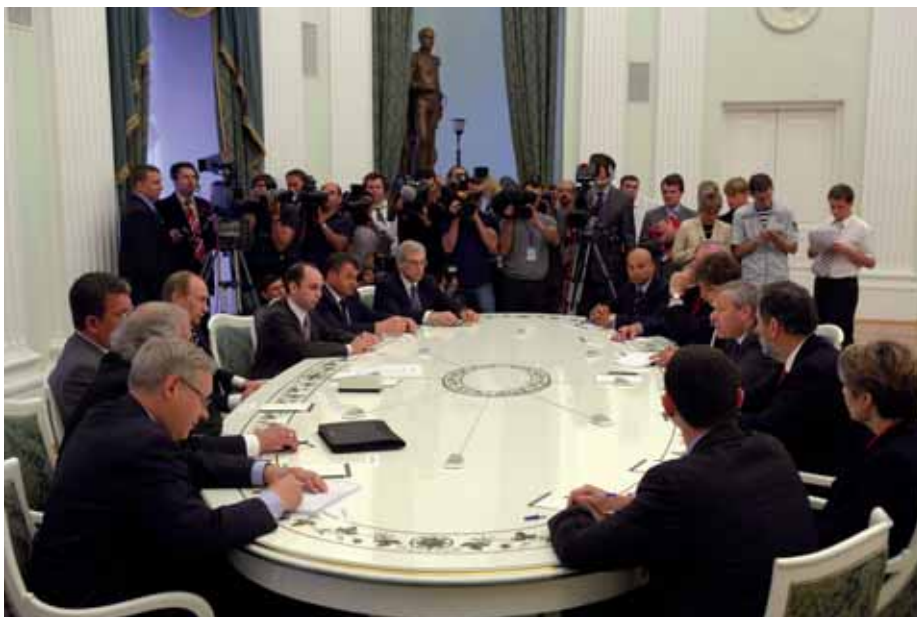
Treffen von NATO-Generalsekretär Jaap de Hoop Scheffer (re.) mit dem damaligen russischen Präsidenten Putin in Moskau.

auch dann wenn die Bereitstellung dieser Fähigkeiten und ihr Einsatz in Krisenregionen wegen des fehlenden Konsens' – nicht über die NATO erfolgen soll. Daraus folgt, dass der »comprehensive approach« weitergedacht und konkretisiert werden und zur Weiterentwicklung der »Umfassenden Politischen Weisung« und der »Ministerial Guidance 2006« führen muss.