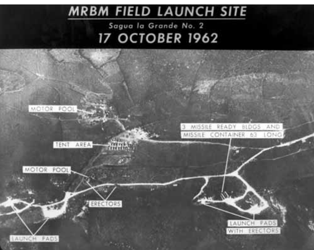
Luftaufnahmen von Raketenstellungen auf Kuba am 17. Oktober 1962.

Der entscheidende politische Wurf nach den Veränderungen in Polen, Ungarn, der DDR und Rumänien, aber auch Bulgarien war die Herstellung der deutschen Einheit auf der Grundlage der 10 Punkte von Bundeskanzler Kohl und dem erfolgreichen Abschluss der 2+4-Verhandlungen. Dazu trug bei, dass die USA alle Vorbehalte in der Allianz gegen die deutsche Einheit einhegten bzw. entkräfteten, dass die Bundesrepublik eine vertiefte Integration in der EU unterstützte und dass mit der Charta von Paris der KSZE die Vision von einem euro-atlantisch-asiatischen Friedensraum von Vancouver bis Wladiwostok skizziert worden war.