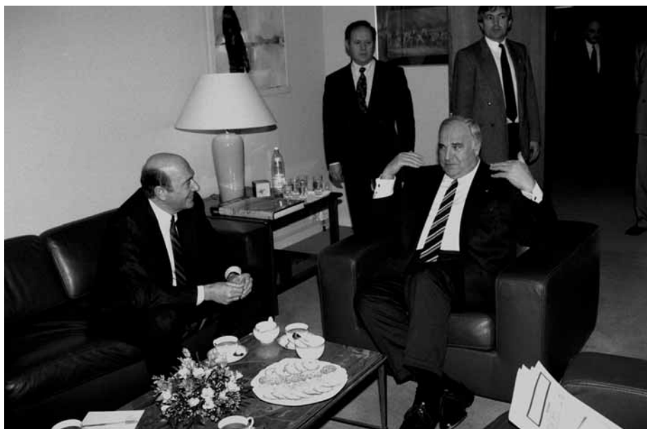
Bundeskanzler Helmut Kohl (re.) beim NATO-Generalsekretär Manfred Wörner.