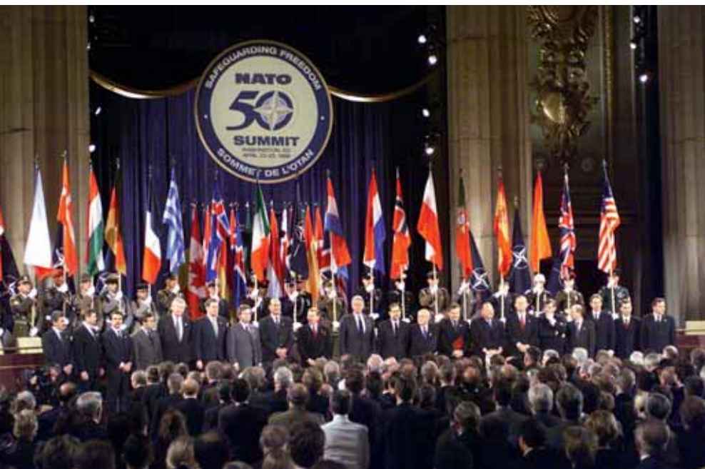
Die NATO feiert ihr 50-jähriges Bestehen 1999 in Washington.