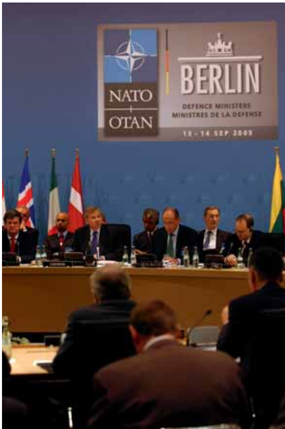
Treffen der NATO-Verteidigungsminister in Berlin.