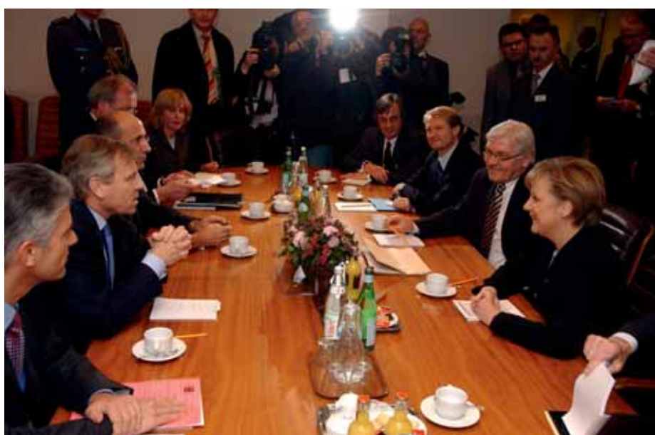
NATO-Generalsekretär Jaap de Hoop Scheffer (li.) im Gespräch mit Bundeskanzlerin Angela Merkel und Bundesaußenminister Frank-Walter Steinmeier.

Als wesentlicher politischer Zweck der Allianz kann absehbar gelten, ein freies, geeintes Europa in Frieden zu schaffen, auszubauen und zu erhalten. Nach Buch-