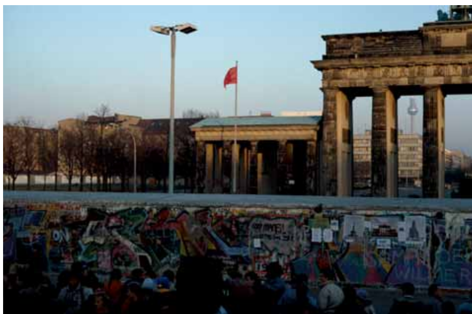
Die Berliner Mauer fällt am 9. November 1989.

Es waren die Ereignisse des 11. September 2001 mit den Anschlägen auf das World Trade Center in New York, auf das Pentagon in Washington und dem vorzeitig zum Absturz gebrachten Flugzeug in