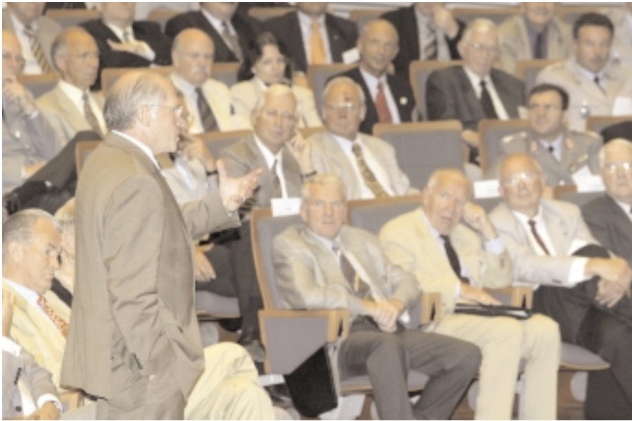
Die rund 300 Teilnehmer trugen durch ihre Beiträge wesentlich zum Gelingen der Tagung bei.

den. Das bedeute, so General Beck, »eine Vervielfachung des Ausbildungsangebotes nach dem 40. Lebensjahr«.