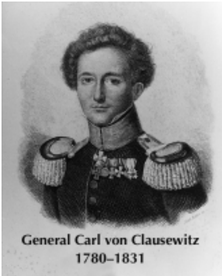
General Carl von Clausewitz 1780-1831